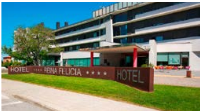
Hotel Eurostars Reina Felicia