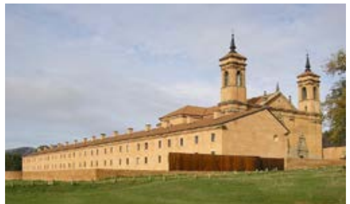
Hospedería de San Juan de la Peña

Por ello, el respeto a ese medio ambiente, la sana curiosidad por lo que se nos muestre, y la máxima absorción de los conocimientos teóricos y prácticos que se pongan a nuestra disposición merecerán seguro de un esfuerzo de atención y silencio por parte de todos.