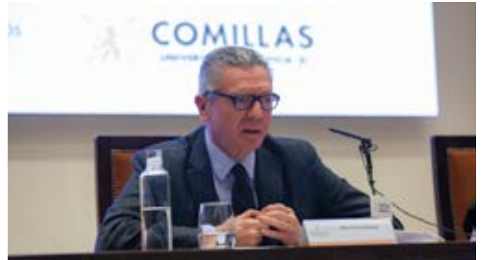
Alberto Ruíz Gallardón

Por su parte, Macarena Olona destacó que entre las semillas que sembraron sus profesores están la metodología, la disciplina, la autoridad y los valores cristianos coincidiendo con sus compañeros en el valor de trabajar para los demás: “Alcanza la excelencia y compártela”