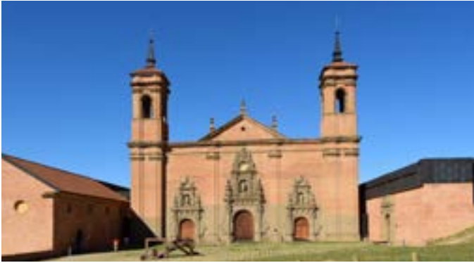
Hospedería de San Juan de la Peña