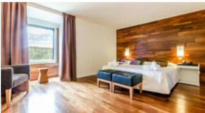
Hospedería de San Juan de la Peña

Se trata de un hotel de cuatro estrellas, ubicado en la parte alta de la Sierra de la Peña, con instalaciones re-