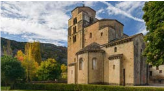
Iglesia de Santa María en Santa Cruz de la Serós