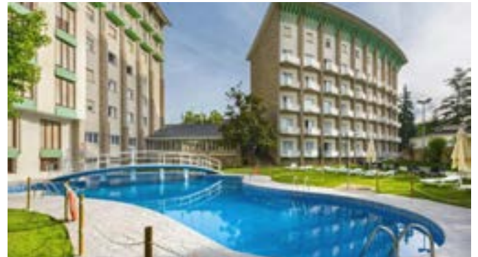
Gran Hotel de Jaca

La habitación doble, en régimen de Alojamiento y Desayuno tendrá un coste de 145 € por habitación y noche, y la doble de uso individual, 115 € por habitación y noche. Otras necesidades, consultar.