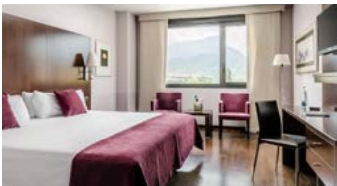
Hotel Eurostars Reina Felicia

La habitación doble, en régimen de Alojamiento y Desayuno tendrá un coste de 140 € por habitación, y la doble de uso individual, 130 € por habitación. Otras necesidades, consultar.