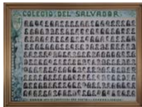
Promoción Bodas de Oro (p.1975)

Se les solicitó que se pusieran en contacto con la Sede de la Asociación de Antiguos Alumnos para poder actualizar sus datos personales, así como que nos enviasen alguna foto de cada una de las celebraciones y una reseña de la experiencia pero tan solo hemos recibido de los antiguos alumnos que celebraron sus Bodas de Oro.