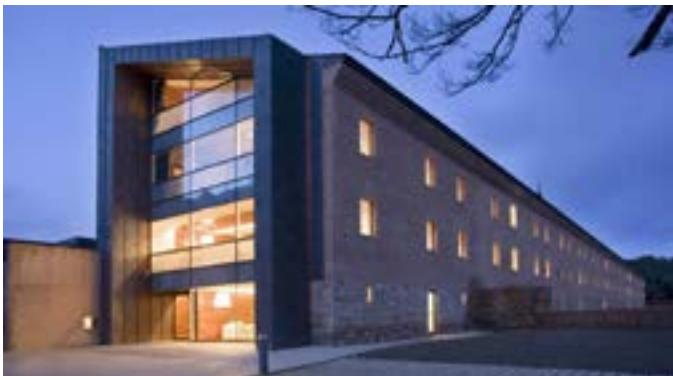
Hospedería de San Juan de la Peña