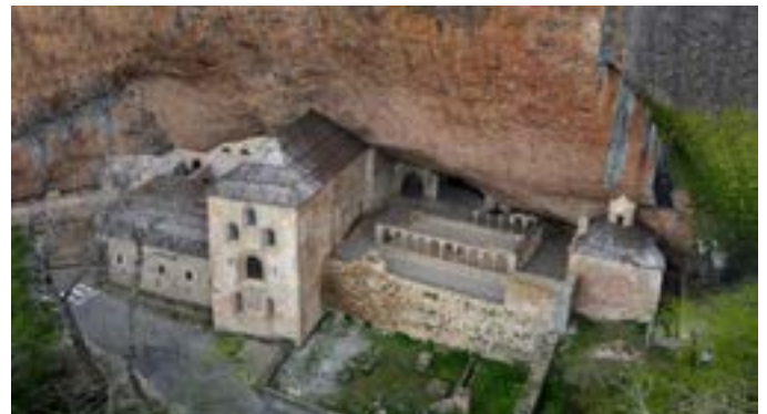
Monasterio de San Juan de la Peña