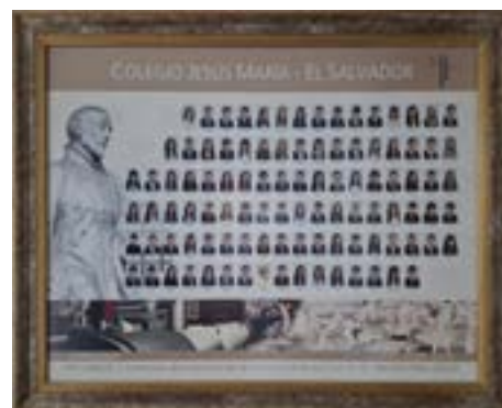
Promoción Bodas de Bronce (p.2010)