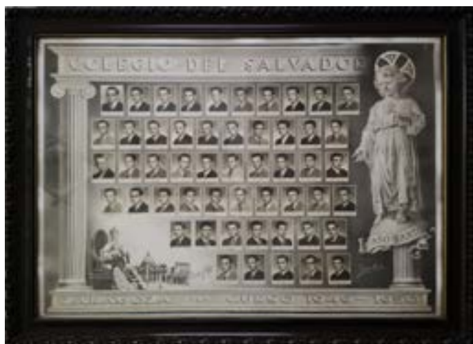
Promoción Bodas de Platino (p.1950)