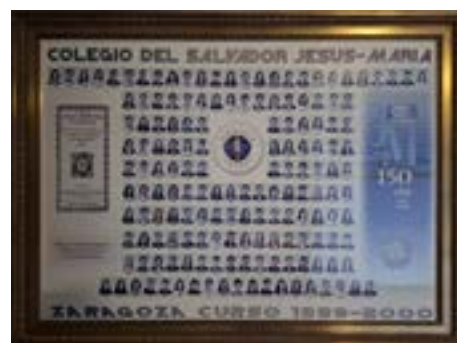
Promoción Bodas de Plata (p.2000)